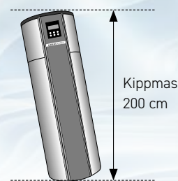
Kippmass 200 cm