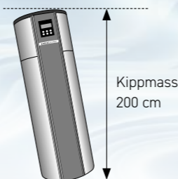
Kippmass 200 cm